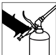
Ghiera per pulizia pistola Attachment for gun cleaning